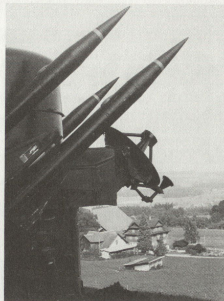
Schild auch gegen oben.

Weil derartige Veranstaltungen immer wieder beweisen – übrigens beidseits der Saane – dass die Bevölkerung zu ihrer Armee steht, sind sie gerade heute dringend geboten, gerade in dieser Zeit, in welcher extreme Gruppierungen die Armee und die Verfechter der allgemeinen Wehrpflicht an den Pranger stellen wollen, und in welcher viele Medien die Entspannung als unaufhaltsam und den Pazifismus als einzig fortschrittliches Verhalten proklamieren. Auch die Feiern zum 25jährigen Bestehen der Mech Div 1 werden de-