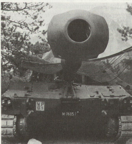
Die moderne Feuerunterstützung.

potentiellen Gegner, seine Kräfte besser als in anderen Landesteilen zu entfalten: Einerseits bieten sich verschiedene Möglichkeiten für operative Luftlandungen an, sei es auf die bestehenden Flugplätze oder in die grösseren Ebenen des Raums; andererseits erleichtern mehrere Achsen, obwohl an einigen Stellen wenig panzergängig, einen Stoss in Ost-West-Richtung und umgekehrt. Schliesslich muss auch damit gerechnet werden, dass Teile der Division, integriert in eine Armeereserve, zugunsten eines anderen Armeekorps eingesetzt werden können. Verlangt ist deshalb die Bereitstellung kampfstarker mechanisierter Reserven unter dichtem Flab-Schutz und das