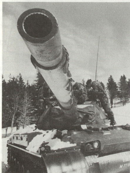
Feuer und Bewegung.

Die Mech Div 1 ist fest in der Bevölkerung verankert und wird zusammen mit ihr am kommenden 19. und 20. Juni in würdigem Rahmen das Jubiläum ihres 25-jährigen Bestehens feiern. ■