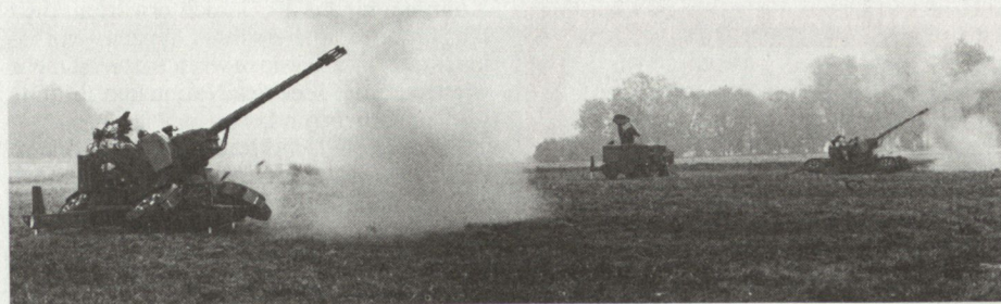
Eine M Flab-Feuereinheit bei der Schussabgabe

Art und Umfang der erschwerten Bedingungen dürfen nicht dem Zufall überlassen werden oder gar das Ergebnis mangelhafter Vorbereitung sein. Nur erschwerte Bedingungen, die von