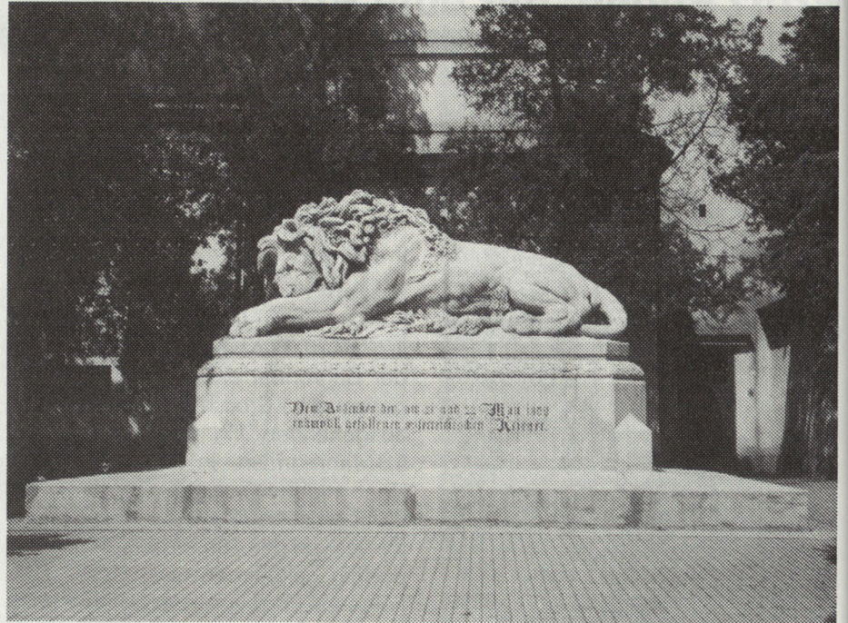
In Aspern bei Wien erinnert ein Denkmal mit sterbendem Löwen an die Schlacht vom 21./22. Mai 1809, in der Napoleon zum erstenmal zu Lande eine Niederlage einstecken musste.

Auf waches Interesse stiessen die Einblicke in das türkische Militärwe-