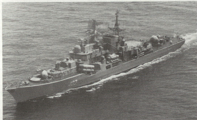
Die Rotbannerflotte schickt zunehmend auch moderne Einheiten, wie hier den Raketenzerstörer Otlichnyi der «Sovremennyi» -Klasse, zur 5. Eskadra ins Mittelmeer.

Diese Feststellung und jene der mangelnden logistischen Abstützung