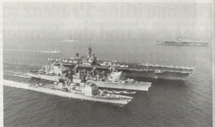
Kernstück der 6. US-Flotte sind die Trägerkampfgruppen, von denen eine bis zwei, in Krisenzeiten auch mehr, zum Verband gehören. Die Aufnahme zeigt den Flugzeugträger USS «John F. Kennedy», der zusammen mit dem hochmodernen Raketenkreuzer USS «Ticonderoga» (vorne) vom Versorgungsschiff USS «Detroit» im Mittelmeer Treibstoff, Munition und Lebensmittel übernimmt. Im Hintergrund der Flugzeugträger USS «Independence».

ungswege sicherzustellen hatte, neu definiert.