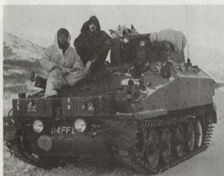
Raupenschützenpanzer SPARTAN des britischen AMF-Kontingents.

Übungen des mobilen Einsatzverbandes der NATO finden in der Regel alle zwei Jahre in diesem Gebiete, das zirka 300 km nördlich des Polarkreises gelegen ist, statt. Wegen der Nähe zur Kola-Halbinsel, wo die Sowjetunion die wichtigsten Stützpunkte für ihre Flotte und die mit ballistischen Atomraketen ausgerüsteten U-Boote unterhält, hat diese Region eine grosse strategische Bedeutung. Norwegen ist allerdings nur einer von verschiedenen vorgesehenen Einsatzräumen der AMF. Weitere mögliche Zielgebiete liegen an den Ostseezugängen in Dänemark, in Norditalien, Griechenland und in der Türkei.