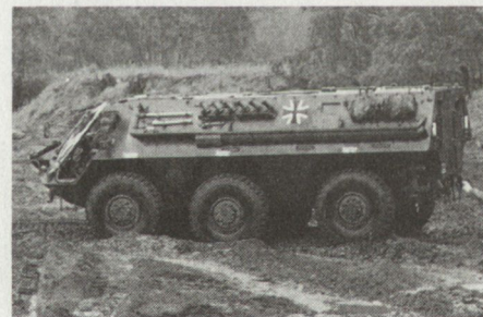
Basisversion des Radschützenpanzers FUCHS, schwimmfähig mit einer Transportkapazität für 14 Mann

Die deutsche Bundeswehr sowie möglicherweise auch die US-Armee sollen mit dem von der Firma Thyssen-Henschel in Kassel entwickelten ABC-Aufklärungsschützenpanzer FUCHS ausgerüstet werden. Nach Mitteilung der Herstellerfirma wurde zu Beginn dieses Jahres die erste Version dieses rund 1,2 Millionen teuren Spezialfahrzeuges an die Bundeswehr abgegeben. Das auf der Basis des Radschützenpanzers FUCHS basierende ABC-Fahrzeug ist mit Spürgeräten und Laboreinrichtungen ausgerüstet, die eine qualitative und quantitative Aufklärung von atomaren, biologischen und chemischen Kampfstoffen aus dem vollständig geschützten Innenraum des Fahrzeuges ermöglichen.