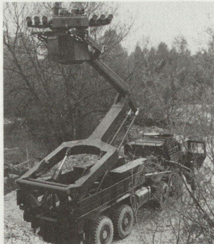
Das neu für die deutsche Bundeswehr geplante Pzaw-System PANTER mit total 6 PAL HOT auf einer elevierbaren Abschussplattform.

Seit der Einführung der PAL-Systeme MILAN und HOT bei der deutschen Bundeswehr sind bereits mehr als 20 Jahre vergangen. Die Nutzungsphase für beide Systeme wird aber vermutlich bis über das Jahr 2000 hinausreichen. Die sich daraus ergebende Lebensdauer von fast 40 Jahren erfordert eine ständige Anpassung an eine sich rasch ändernde Bedrohungssituation und den entsprechenden militärischen Forderungen.