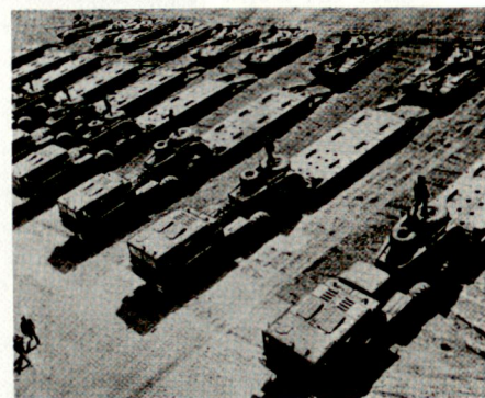
Verlad einer sowjetischen Panzerkompanie T-64 B auf Tiefladeanhänger

In den sowjetischen Landstreitkräften existieren auf Stufe Armee und Front spezielle Transporteinheiten. Nebst schweren Transportfahrzeugen verfügen diese auch über Tiefladeanhänger, womit Kampfpanzer über grössere Distanzen verschoben werden können.