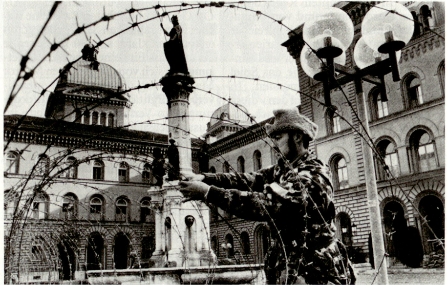
Das Bundeshaus, militärisch bewacht

lungen ist nachzutragen, dass auch hier keiner Partei unterstellt wurde, sie wolle die Schweiz als Staat niederwerfen, sondern dass unser Land aufgrund seiner geostrategischen Lage in den Konflikt und in die Operationslinien der Kriegführenden geriet.