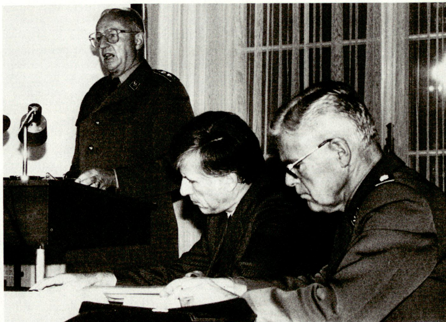
Die Spitze der Übungsleitung

Gesamthaft gesehen brachte die GVV 88 für die zivilen Behörden und Verwaltungsbereiche eine Fülle von Erkenntnissen, die nicht zuletzt auch in die Ausbildung verschiedener Funktionsträger einfließen wird. Sie hat damit einen wesentlichen Zweck erreicht. Unabhängig wie in Zukunft die Gewichte in der Sicherheitspolitik gesetzt werden, wird der Test des Zusammenspiels einzelner Teile im Rahmen grösserer Übungen nicht zu umgehen sein. Manches, was auf dem Papier beeindruckt, hat schon in der Übungspraxis keinen Bestand.