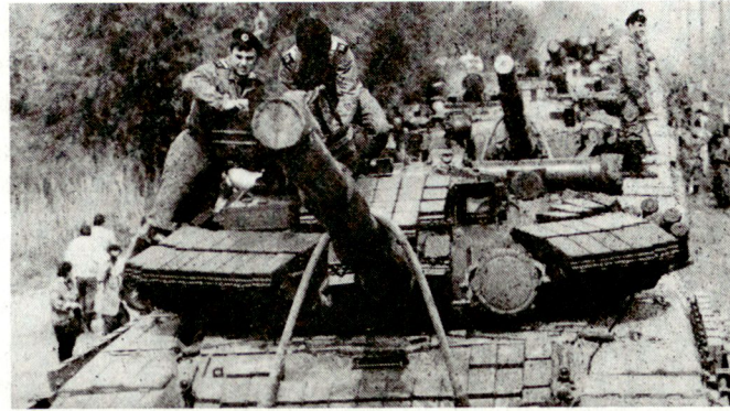
Abzug sowjetischer Panzer aus Ungarn. Zu beachten ist die angebrachte Reaktivpanzerung z. T. auch seitlich über den Schürzen

Wie die in der Militärpresse erschienenen Bilder der ersten Abzugsphase zeigen, werden aus der DDR primär Kampfpanzer des Typs T-64A abgezogen. Diese Version wurde ab Mitte der siebziger Jahre den sowjetischen Truppen zugeführt. Sie werden dort seit einiger Zeit durch die neuen Typen T-64B und T-80 ersetzt.