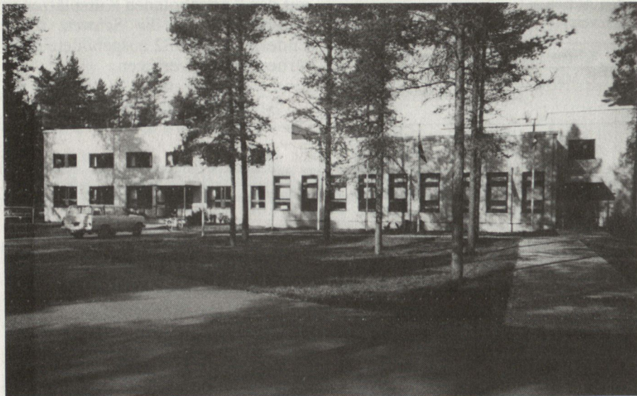
Das Ausbildungszentrum ist dem Satakunta Art Rgt angegliedert und verfügt über modernste Einrichtungen.

Auftrag der 4 Nordischen Staaten Schweden, Dänemark, Norwegen und Finnland durchgeführt (Schweden bildet die Staboffiziere, Dänemark die Militärpolizei und Norwegen die Logistikkoffiziere aller 4 Nordischen Staaten aus).