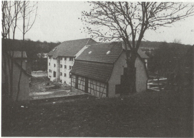
Bild 3. Ortskampfanlage «Bonnland»: Neubau und renovierte Gebäude mit Umgebung