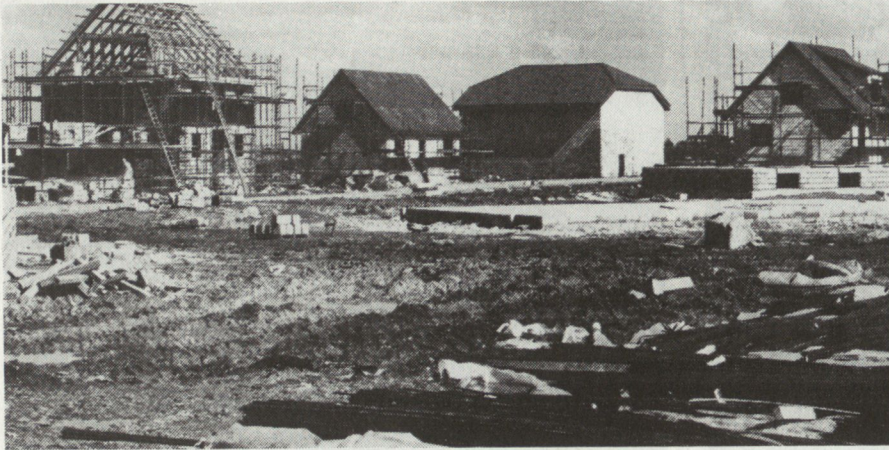
Bild 6. Ortskampfanlage «COPEHILL»: Ein- und Mehrfamilienhäuser, Scheunen zum Einstellen von Panzern