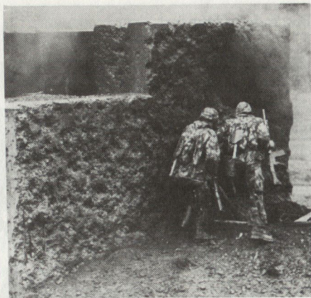
Bild 7. Bunkerartiges Häuserkampfobjekt in Walenstadt

■ Drittens: Die Ausbildungsanlagen müssen erweitert, ergänzt und zum Teil neu konzipiert werden. Beispielsweise müssen die bestehenden, jedoch vollständig zerschossenen Häuserkampfobjekte ersetzt und zu eigentlichen Ortskampfanlagen erweitert werden. Um zudem auf den Bau der bisher erstellten «Bunker» (Bild 7) zugunsten von landesüblichen Gebäuden verzichten zu können, soll das Verbandstraining des Ortskampfes wie erwähnt nicht mehr im scharfen Schuss, sondern mit Hilfe der Infanteriewaffen-Laser-Simulation und allenfalls unter Verwendung von Kurzbahn-Patronen und neuen Zieldarstellungsmöglichkeiten durchgeführt werden können.