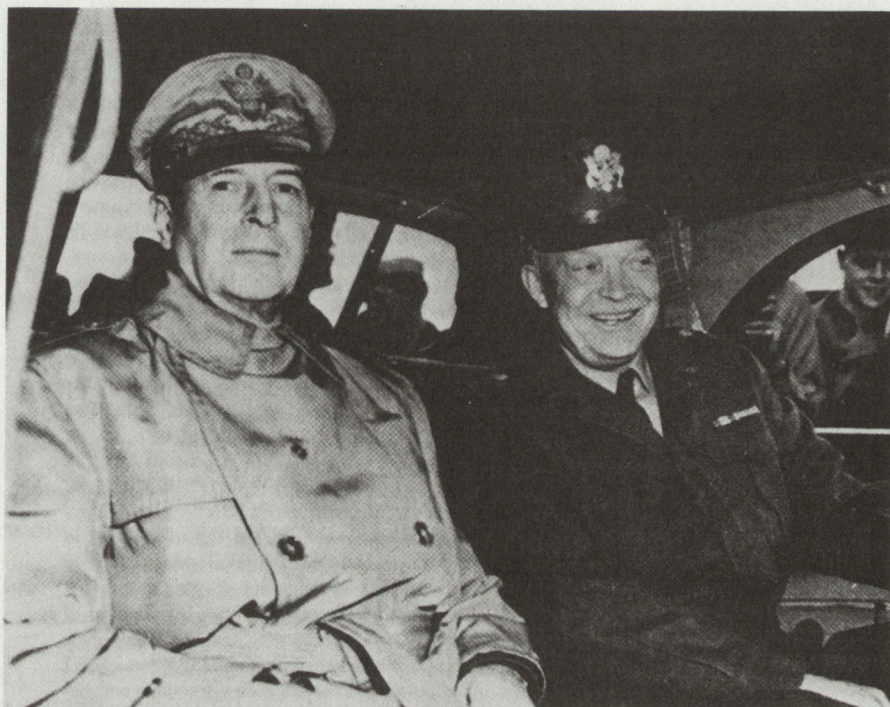
MacArthur und Eisenhower in Japan im Mai 1946.

Im Alter von 38 Jahren wird MacArthur Divisionsgeneral, Kommandant der Regenbogendivision; er gerät bald einmal in Widerspruch und Streit mit dem Hauptquartier der Amerikaner in Frankreich, dessen Chef Georg Marshall heisst, später Chef des Vereinigten Generalstabes der USA im Zweiten Weltkrieg. Die dauernden Schwierigkeiten, die MacArthur während seiner über 50jährigen Karriere in der amerikanischen Armee begleiten, führt er auf diese Differenzen zurück, ohne zu erkennen, dass sein