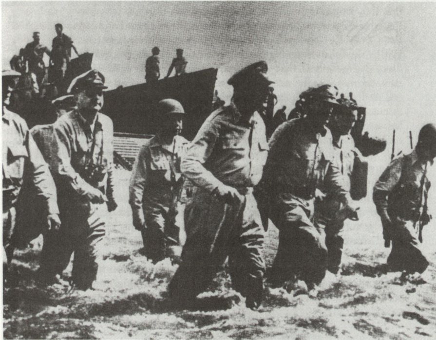
Wie er vorausgesagt hatte, kehrte er (im Oktober 1944) als Sieger auf die 1941/42 von Japan eroberten Philippinen zurück.

den nach Norden. Drei grosse Seeschlachten, die zum Teil mit Aktionen MacArthurs im Zusammenhang standen, wurden geschlagen und zerstörten Flotte und Luftwaffe der Japaner: Die Schlacht in der Coral Sea, die Schlacht um Midway und die Schlacht im Leyte-Golf, bei der Landung der Armee unter MacArthur auf den Philippinen, die sein berühmtes Versprechen wahr machte: «Ich werde zurückkommen.»