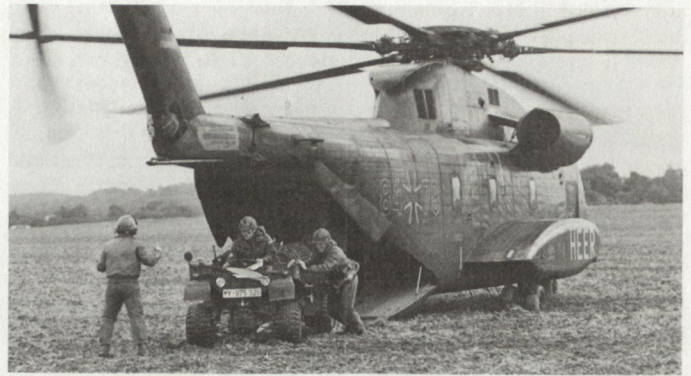
Von den bevorstehenden Reduzierungen bei der Bundeswehr wird vor allem das deutsche Heer betroffen sein.

Zusätzlich besitzen die schwedischen Landstreitkräfte (Heeresfliegertruppe) etwa 80 Helikopter und rund 20 leichte Verbindungsflugzeuge. Die Marine schliesslich hat etwa 25 Luftfahrzeuge in Dienst. hg