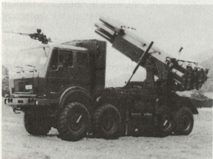
Schwerer Mehrfachraketenwerfer 262 mm aus jugoslawischer Produktion, die maximale Schussdistanz liegt bei 60 km.

Vielfältig sind auch die Tendenzen auf dem Gebiete neuer Werkstoffentwicklungen und Schutztechnologien. Dabei werden vor allem weitere Anstrengungen unternommen, um die Überlebensfähigkeit von mechanisierten Kampfmitteln weiter zu verbessern. Nach der reaktiven Panzerung (Reaktivpanzerung) hat sich nun auch der Begriff «aktive Panzerung» definitiv durchgesetzt. Durch eine am Kampffahrzeug aufgebaute Schutzsprengladung sowie am Fahrzeug integrierten modernen Sensoren sollen anfliegende Pzaw-Geschosse bereits in