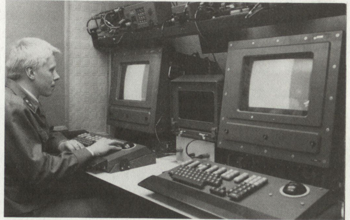
Automatisierte Führungssysteme in verschiedenen Einsatzbereichen bilden einen Schwerpunkt bei den gegenwärtigen Rüstungsentwicklungen.