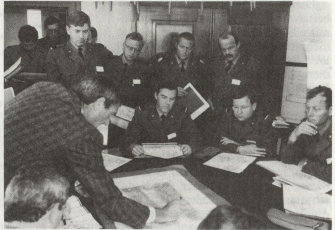
Abb. 3: Für spezielle Übungen werden auch zivile Experten bei gezogen.