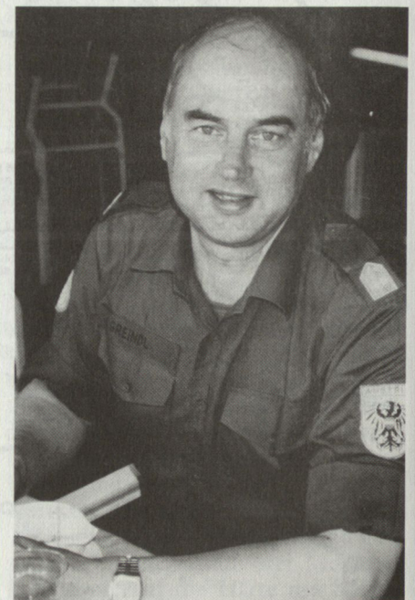
Der Oberkommandierende Generalmajor Greindl aus Österreich verfügt über jahrelange Erfahrung bei friedenserhaltenden Operationen der Vereinten Nationen.

Unter der Oberaufsicht des UNO-Generalsekretärs und des Sicherheitsrates wurde Generalmajor Günther G. Greindl zum Oberkommandierenden der militärischen Beobachtermission ernannt. Er ist 51 Jahre alt, 1977/