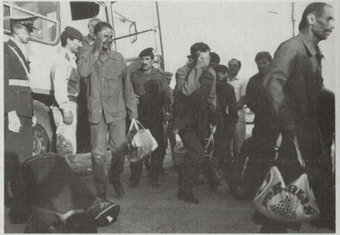
Iraker kehren aus kurzer Gefangenschaft zurück. Missionen der Hilfswerke in Gefängnissen finden meistens unter Ausschluss der Medien statt.