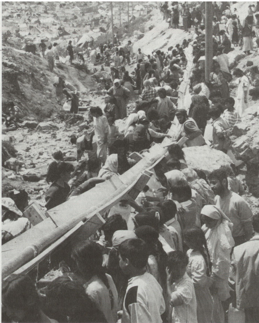
Wassernot können sich Westeuropäer nur schwer vorstellen. Deshalb schicken Rotkreuzvertreter solche Bilder – hier von kurdischen Flüchtlingen – nach Hause.

Über erlittene Kollateralschäden Iraks war das IKRK übrigens, wie in Bonn bestätigt wurde, laufend informiert. Die Meldungen betrafen die Energie – wo die Schäden eine «humanitäre Katastrophe» auslösten – und die Wassernot im Süden, die zu Epidemien führte, was das Einfliegen von Infusionsmitteln nötig machte. «Aber unsere Communiqués darüber haben kaum etwas bewegt», klagte der Sprecher des IKRK.