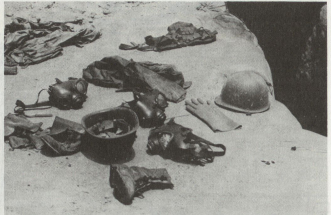
In der südlichen «Saddam-Husseini-Verteidigungslinie» liegen in grossen Mengen Ausrüstungsgegenstände, Waffen und Munition herum.