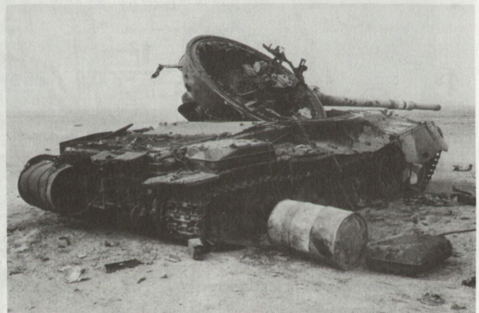
Bei IRISHAN finden wir in der Wüste in den zerschlagenen Bereitstellungsräumen irakischer Panzerverbände Hunderte von Panzern, Kampfschützenpanzern, Artillerie- und Flabgeschützen. Die Wirkung moderner panzerbrechender Munition ist von kaum beschreiblicher Wucht.