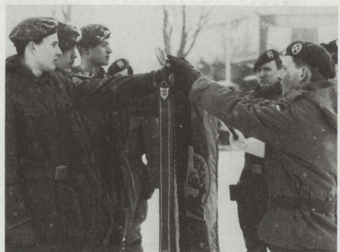
Wer gestern Feind war, muss heute Kamerad sein. Erstmalige Verteidigung junger Soldaten aus beiden Teilen Deutschlands in Hamburg 1990 (Bild key).