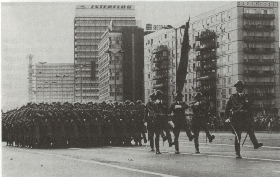
Aus vergangenen Zeiten: Parade der Nationalen Volksarmee auf der Karl-Marx-Allee in Berlin zum 15. Jahrestag des Mauerbaus 1976 (Bild key).

bestätigt ein internes Papier der Bundeswehr.