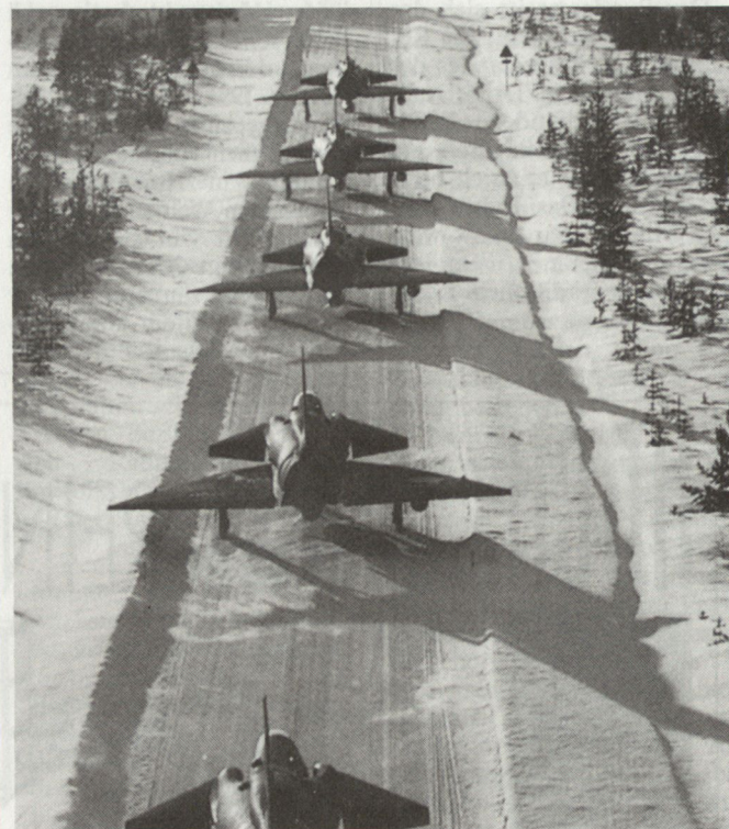
Eine Projektgruppe ist daran, die schwedische Luftraumverteidigung zu überprüfen.

Das Forschungsprojekt Luftverteidigung soll bis Mitte 1993 abgeschlossen sein. Damit beschäftigt sind ungefähr 100 Personen aus verschiedenen Bereichen des Verteidigungsministeriums und der staatlichen Rüstungsindustrien. hg