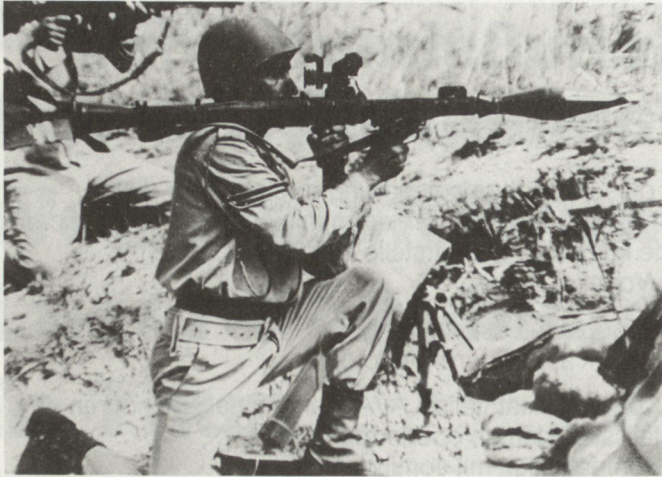
Infanterist mit Rak-Rohr RPG-7.