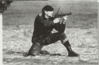
40 mm Grenade-Pistol