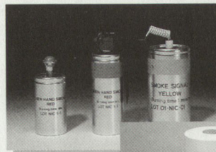
Coloured Smoke Grenades