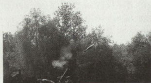
Mortar 120 mm