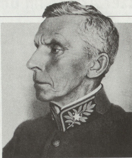
Oberstkorpskommandant Theophil Sprecher von Bernegg, der Schöpfer der TO 11, 1850–1927 1913–1919 Generalstabschef 1902–1909 Kdt 8. Div 1909–1912 Kdt 4. AK

Der Kampf um die Neugliederung des Heeres wurde sowohl in der Landesverteidigungskommission als auch in der Öffentlichkeit mit äusserster Heftigkeit geführt. Ulrich Wille und seine Anhänger kritisierten dabei vor allem die Schwerfälligkeit der neuen grossen Divisionen mit 3 Brigaden zu 2 Regimentern, welche mit ihren 22 000 bis 25 000 Mann als kleine Armeekorps besonders für Milizoffiziere fast nicht mehr führbar waren, sowie die ihrer Ansicht nach viel zu grosse Zahl der neugeschaffenen Gebirgstruppen. Überdies war der nachmalige General der Meinung, dass es angesichts der sehr schlechten aussenpolitischen Lage, der fehlenden Konsolidierung des Wehrgesetzes von 1907 sowie des mangelhaften Ausbildungsstandes von Truppe und Führern sehr gefährlich sei, noch all die Unruhe hineinzubringen, welche die Änderungen und Reformen der Truppengliederung während vieler Jahre nach sich ziehen würde 2 .