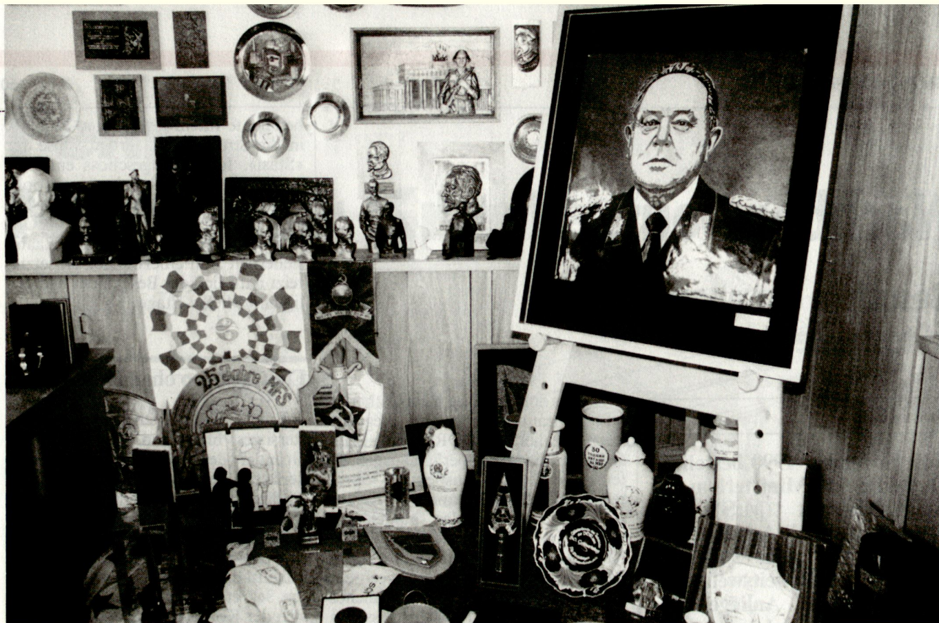
«Stasi»-Zentrale. Politkult.

Drang, den Arbeiter herauszukehren, der keinen Luxus braucht. Dazu steht im Gegensatz das Jagdbild in seinem Privatbereich, das schliesslich von seiner Jagdleidenschaft zeugt, die im Normalfall nicht das Hobby eines Arbeiters ist. Mit der Auflösung des MfS fand der in nahezu allen Büros vorhandene Zimmerschmuck keine Verwendung mehr, viele Gegenstände füllten unzählige Mülltonnen, manch privates Stück von den ehemaligen MfS-Mitarbeitern wechselte den Besitzer. Das Bürgerkomitee Berlin «retete» diese Zeitzeugen der Geschichte, um sie für Ausstellungszwecke zu erhalten. Die ausgestellten Gegenstände erhielt das seinerzeitige Ministerium für Staatssicherheit als Geschenke zu Jubiläen, Ehrungen und Parteiauszeichnungen. Viele dieser Büsten, Teller, Plaketten usw. sind Massenanfertigungen, darunter befinden sich auch eine ganze Reihe von Einzelstücken, die zum Teil von Laienkünstlern stammen.