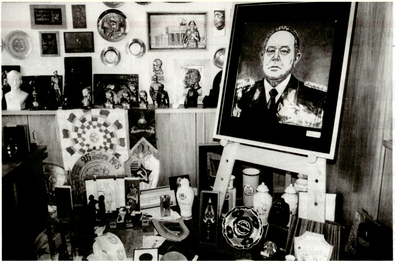
«Stasi»-Zentrale. Politkult.

Drang, den Arbeiter herauszukehren, der keinen Luxus braucht. Dazu steht im Gegensatz das Jagdbild in seinem Privatbereich, das schliesslich von seiner Jagdleidenschaft zeugt, die im Normalfall nicht das Hobby eines Arbeiters ist. Mit der Auflösung des MfS fand der in nahezu allen Büros vorhandene Zimmerschmuck keine Verwendung mehr, viele Gegenstände füllten unzählige Mülltonnen, manch privates Stück von den ehemaligen MfS-Mitarbeitern wechselte den Besitzer. Das Bürgerkomitee Berlin «retete» diese Zeitzeugen der Geschichte, um sie für Ausstellungszwecke zu erhalten. Die ausgestellten Gegenstände erhielt das seinerzeitige Ministerium für Staatssicherheit als Geschenke zu Jubiläen, Ehrungen und Parteiauszeichnungen. Viele dieser Büsten, Teller, Plaketten usw. sind Massenanfertigungen, darunter befinden sich auch eine ganze Reihe von Einzelstücken, die zum Teil von Laienkünstlern stammen.