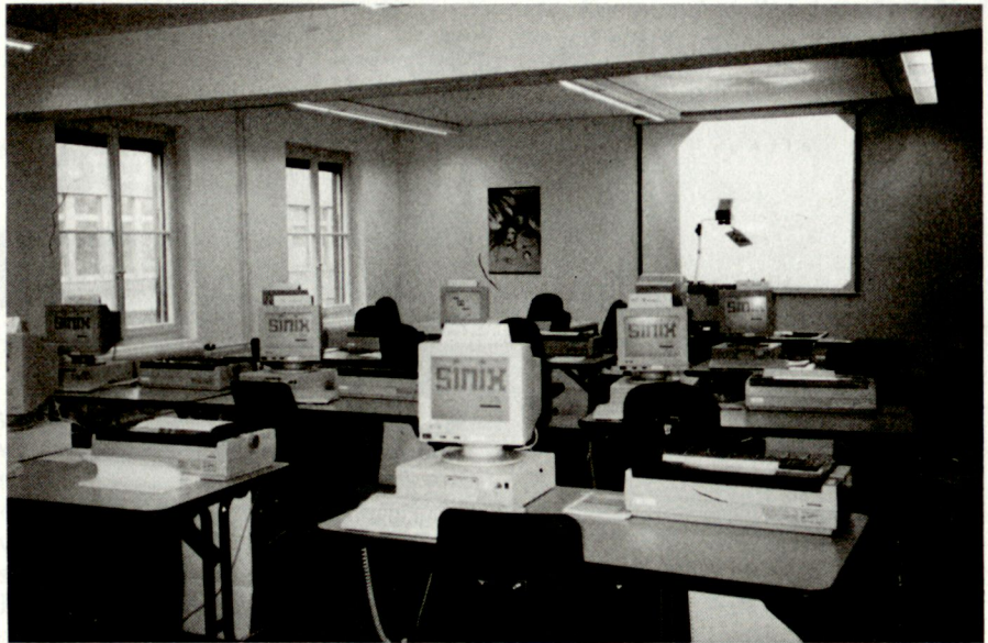
Der Einsatz von EDV verlangt von den Benutzern intensive Schulung; das EMD verfügt dafür über eine moderne Infrastruktur.

TERZIS ist als sogenanntes logistisches Informationssystem im Applikationsbereich in eine zentrale Auftrags- und in eine regionale beziehungsweise zentrale Bestandesverwaltung aufgeteilt und fügt sich harmonisch in das neue Informatik-Leitbild der Armee. Es soll gesamtschweizerisch und dezentral funktionieren, durch optimale Lagerbewirtschaftung Kosten sparen und die Auskunftsbere-