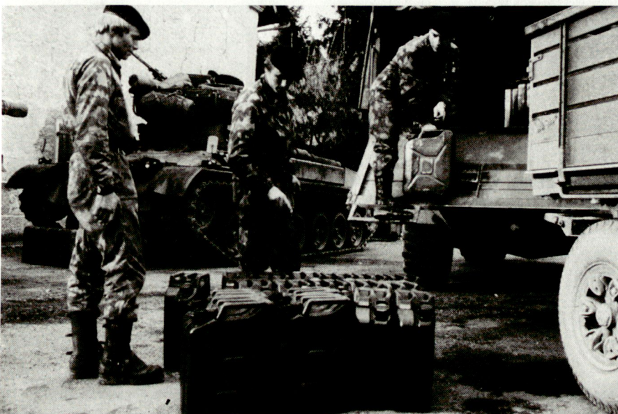
Das Territorialzonen-Informationssystem TERZIS sorgt dafür, dass etwa ein Panzerbataillon immer und überall über Brennstoff verfügt.

W.J.: An erster Stelle steht sicherlich die Dezentralität von TERZIS. Territorialzonen und Versorgungsregimenter