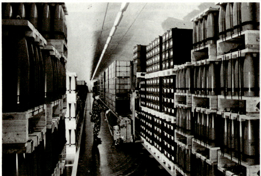
Die Bewirtschaftung von Munitionsbeständen stellt heute eine ungeheure logistische Aufgabe dar, die ohne den Einsatz von EDV kaum mehr zu bewältigen ist.

Sobald die Strukturen für die Armee 95 sowie das Versorgungskonzept 95 bereinigt und genehmigt sind, werden das Einsatzkonzept und das militärische Pflichtenheft für das Versorgungsführungs- und Informationssystem als rein militärische Anwendungen den neuen Gegebenheiten angepasst.