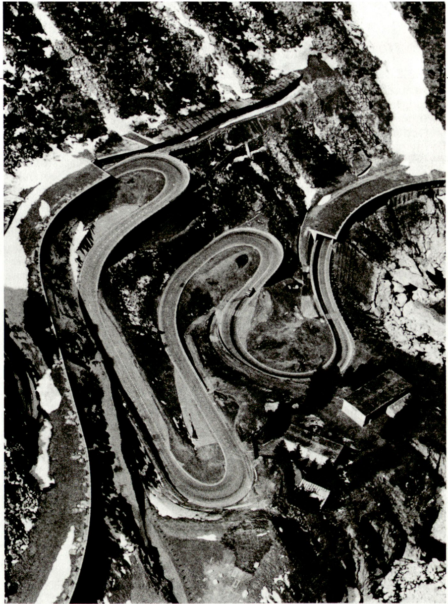
Die für den Transport von Gütern und Energie bestimmten Transversalen schützen (Achse Gotthard, oberhalb Göschenen)

Der Begriff des Reduit wies somit zwei Aspekte auf: es entsprach einer