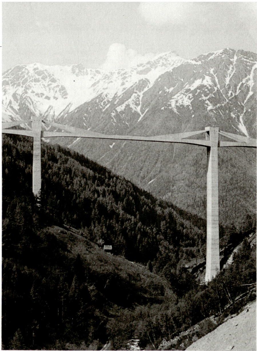
Offenhalten, nicht mehr zerstören, um jeden Preis und in jeder Situation (Ganderbrücke, Simplonpass)

Ausgehend von politisch-strategischen Überlegungen hat der Bundesrat wichtige Entscheide für unser mili-