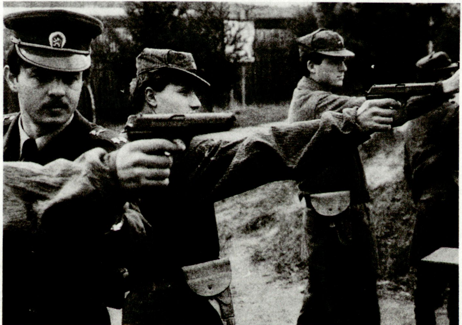
Schon heute leisten die Rekruten ihren Dienst bei Verbänden, die in ihren Heimatrepubliken stationiert sind.