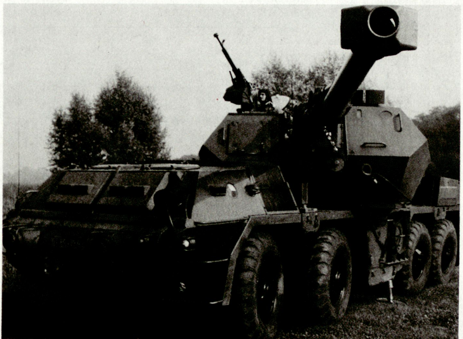
Die ehemals umfangreiche Rüstungsindustrie der CSFR steckt in einer Krise: Die weitere Produktion von Artilleriesystemen (Bild M-77 DANA) in der Slowakei scheint heute gefährdet.