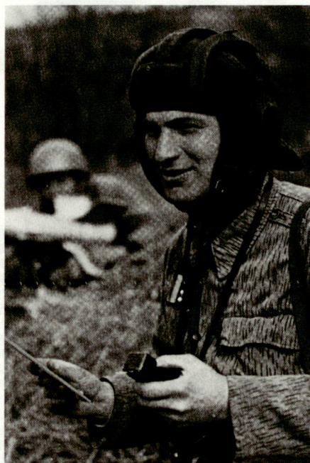
Ungewisse Zukunft für tschechoslowakische Berufssoldaten, die heute in der Nachbarrepublik Dienst tun.

Zusammen mit der Redislozierung ist auch eine Reduktion der Kampfd divisionen von früher 15 auf noch deren 7 verbunden. Die Bildung von neuen militärischen Regionalkommandos in Mähren und in der Slowakei ist unterdessen grösstenteils vollzogen. Bereits auf Beginn des Jahres 1992 trat zudem