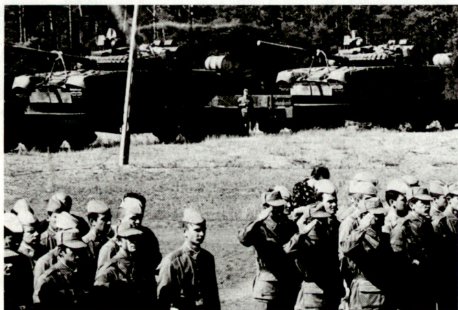
Bis Herbst 1992 soll das Gros der ehemals sowjetischen Nordgruppe aus Polen abgezogen sein. Bild: Panzertruppen mit KPz T-80 vor dem Abzug.