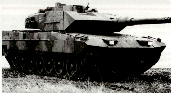
Nachdem in Deutschland auf die Entwicklung eines neuen Kampfpanzers verzichtet wird, soll der Kampfwertsteigerung des Leopard 2 (Bild) mehr Bedeutung zukommen.

– Entweder den Bestand der Streitkräfte noch weiter – unter die Grenze von 370 000 Mann – reduzieren, damit Geld für eine erstklassige Bewaffnung und