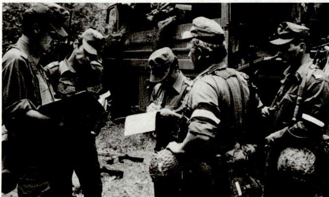
Auch in Österreich wird das bisherige Wehrsystem in Frage gestellt.