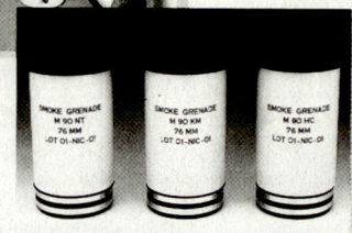
76 mm - Wurfkörper

Weitere Erzeugnisse: Leucht- und Signalgeräte - Gefechtsdarstellungssysteme - Sicherheitsbedarf - Einzelteile