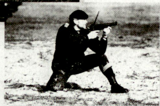
40 mm - Granatpistole