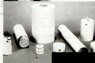
NT - Nebel