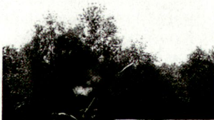
Mörser 120 mm