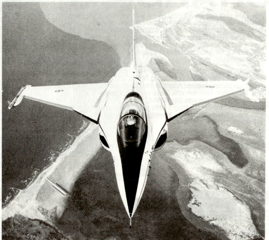
Europa entwickelt derzeit neue Kampfflugzeuge der sogenannten vierten Generation: EFA (Jäger 90), Jas-39 Gripen und Rafale (siehe Abbildung).