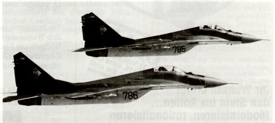
MiG-29 Fulcrum, der heute in kleiner Anzahl bei den meisten Oststaaten im Einsatz steht.