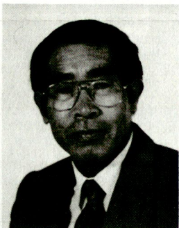
Ryoji Onodera; 1987 Sektionschef für Auswärtige Belange des Verteidigungsministeriums in Tokio; 1990 Ausserordentlicher und bevollmächtigter Botschafter in Syrien; 1992 Ausserordentlicher und bevollmächtigter Botschafter in Österreich.

Um das Interesse Japans an der sicherheitspolitischen Entwicklung in Europa zu verstehen, ist es notwendig, die Situation in Europa, am Atlantik und im Fernen Osten sowie am Pazifik miteinander zu vergleichen. Die Auflösung der Sowjetunion und des Warschauer Paktes hat auch in der sicherheitspolitischen Situation im Fernen Osten grundsätzliche Änderungen mit sich gebracht.