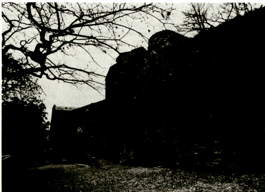
Majorie, Kaserne von 1842 bis 1942