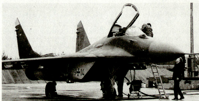
Ein MiG-29 der deutschen Luftwaffe auf dem Luftwaffenstützpunkt Preschen.

Das System CATRIN, das komplexe Gefechtsfeldsituationen übersichtlich machen sollte, kann aber auf zivilen und paramilitärischen Gebieten eingesetzt werden, zum Beispiel zur Geländeüberwachung mittels Monitoren an Verkehrsachsen und Infrastrukturen, zur Beschaffung und Auswertung von meteorologischen Daten, für die Luftverkehrskontrolle, für die Überwachung der öffentlichen Ordnung, für die Koordination von Zivilschutz- und Katastropheneinsätzen usw. Bt