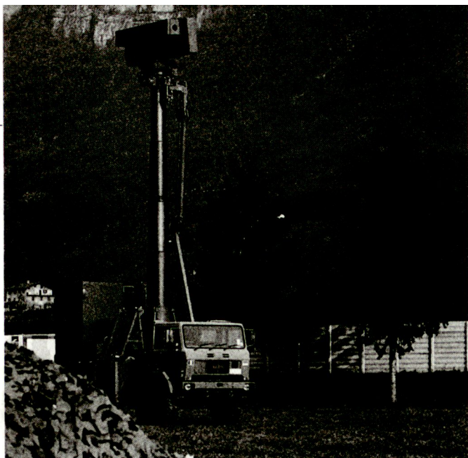
Seit Mitte der 80er Jahre steht in Italien das Führungsinformationssystem CATRIN in Entwicklung, von dem nun einige Teilkomponenten bei den Streitkräften im Einsatz stehen. Im Bild Multifunktionsradar RAT 30-C des Teilsystems SOATCC.

Transportaufgaben werden weiterhin durch C-160 Transall ausgeführt werden. Diese Flugzeuge erhalten ein GPS-System, ebenso wie die 4 Boeing 707, die demselben Zweck dienen. Zwei der drei Airbusse A-310 (der ehemali-