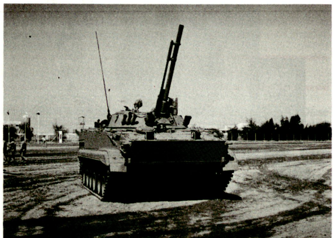
Russischer Kampfschützenpanzer BMP-3 in der verbesserten Version mit Wärmebildgerät: Gesamthaft sollen in den nächsten Jahren zirka 450 BMP-3 an die Emirate geliefert werden. ■

schlagenen Wirtschaft dringend benötigte Devisen zu beschaffen. Die grosse Präsenz an der IDEX 93 liess sich Russland etwas kosten: Nebst den zahlreichen Vertretern der staatlichen Rüstungs- und Exportagenturen waren zusätzlich für Bedienung, Unterhalt und Bewachung der diversen vorgeführten Waffen- und Gerätesysteme zirka 300 russische Soldaten in Uniform an der IDEX 93 eingesetzt. Noch bestehen in der Golfregion grosse Beschaffungsbedürfnisse für Rüstungsmaterial, wovon sich auch Russland einen Anteil sichern möchte. Allerdings haben bisher vor allem die westlichen Rüstungsindustrien, allen voran die «Siegerstaaten» des letzten Golfkrieges, das grosse Geschäft gemacht. Nach den USA und Grossbritannien hat nun auch Frankreich, mit der vorgesehenen Lieferung von 436 Kampfpanzern LeClerc an die Emirate, einen Grossauftrag eingefahren. Aber auch Russland ging bisher nicht leer aus: Vorgesehen ist die Lieferung von rund 450 Kampfschützenpanzern BMP-3 an die Vereinigten Arabischen Emirate. Ob sich der gewaltige Aufwand Russlands an der IDEX gelohnt hat und weitere Aufträge an die russische Rüstungsindustrie folgen werden, wird die nächste Zukunft zeigen. hg