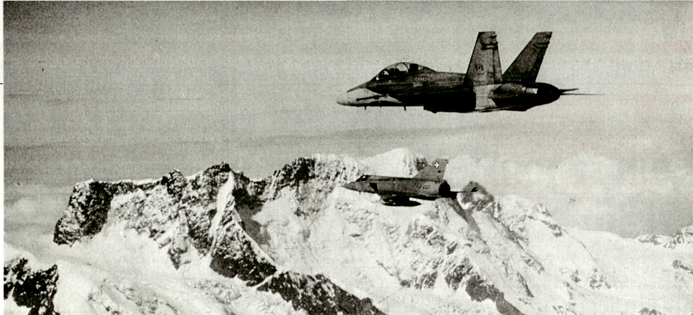
Moderne Flugwaffe schützt Leben am Boden: Hornet F/A-18 (oben) und Mirage III S über den Alpen.

wird, und die jetzigen Initiativen von der «Gruppe für eine Schweiz ohne Armee» nur als Zwischenspur dorthin bezeichnet werden.) Trotz der damaligen Friedenswelle sowie des Irrglaubens, mit dem Ende des Kalten Krieges würden Kriege aus der Geschichte verschwinden, erteilte unser Volk der «eins» eine Abfuhr. Und es hatte recht.