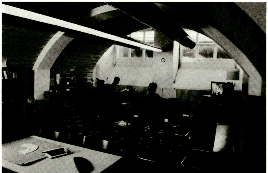
Auch Soldaten haben Anspruch auf anständige Unterkünfte: Freizeitraum der Kaserne Aarau.

Die Politik kennt den Weg der langfristigen Verantwortung und die Sackgasse des momentanen Spektakels. Der Weg des Bundesrates ist jener der Verantwortung. Gerade in der Sicherheitspolitik will er mit der Zeit gehen, ohne aber mit dem Zeitgeist zu schwanken. Die beiden Initiativen hingegen, über die am 6. Juni abgestimmt wird, orientieren sich an kurzfristigem, auf Effekthascherei bedachtem Opportunismus. Dazu sagen Bundesrat und Parlament ganz klar NEIN. Denn nein sagen heisst hier: Verantwortung tragen.