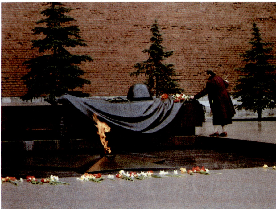
Die Ehrenwachen beim Grab des unbekanntes Soldaten an der Kreml-Mauer sind abgezogen: Die Auswirkungen des Zerfalls der UdSSR, der neuen geostrategischen Lage und der inneren gesellschaftlichen Umwälzungen haben die Probleme für die Streitkräfte zusätzlich verschärft.

schlechtert: Alkoholismus, Drogenabhängigkeit und Kriminalität sind im Steigen begriffen. Jeder fünfte Stellungspflichtige kommt mit der Rechtsordnung in Konflikt, 10% sind bereits vorbestraft. Die Vorbildung und die physische Fitness sind rückläufig, ebenso wie die patriotische Einstellung. 1988 hatten noch 93% der Rekruten Sekundarschulbildung oder eine entsprechende technische Ausbildung. 1993 waren es noch 76%. Die Zahl der Stellungspflichtigen ohne Sekundarschulbildung stieg von 12 auf 22%. Alarmierender ist die Tatsache, dass rund 13% der Stellungspflichtigen weder einer Arbeit noch einer Ausbildung nachgegangen sind.