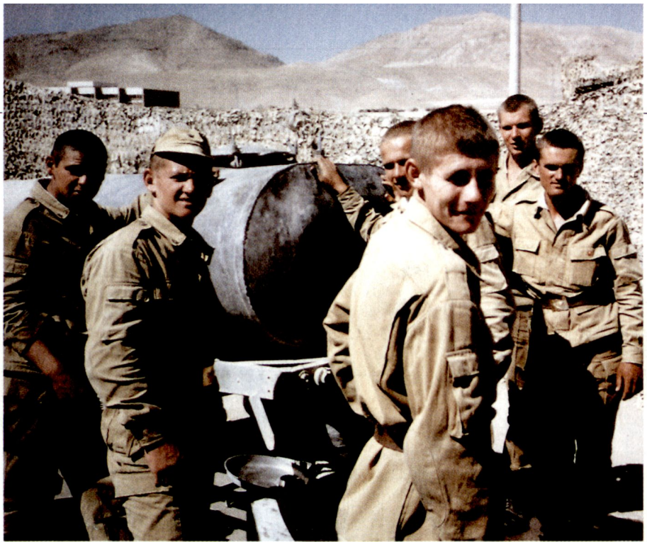
Allein die Beobachtungen im Afghanistan-Krieg vor Ort brachten die in der Vergangenheit sorgsam kaschierten Mängel in den Streitkräften ans Tageslicht. Junge Elitesoldaten beim Wasserfassen ausserhalb ihrer Garnison zum Schutze Kabuls und der wichtigsten Verbindungsstrasse über den Salang-Pass.