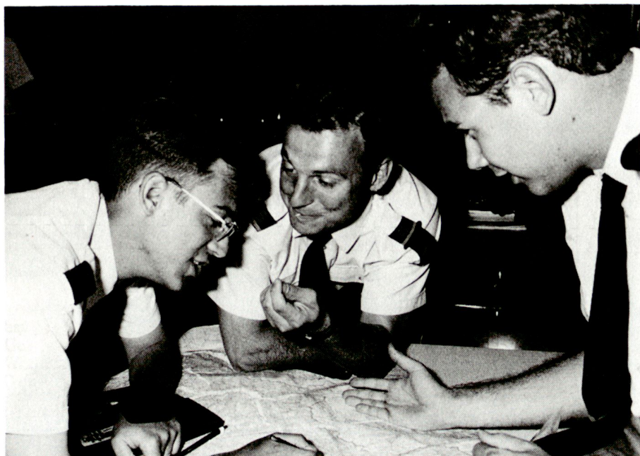
Diskussion über das Ergebnis einer Übung mit Landeskarten: Aspiranten der Stabssekretär-Offiziersschule während ihrer Ausbildung.

Sport und Pistolenausbildung haben im Ausbildungsplan ebenfalls einen hohen Stellenwert.