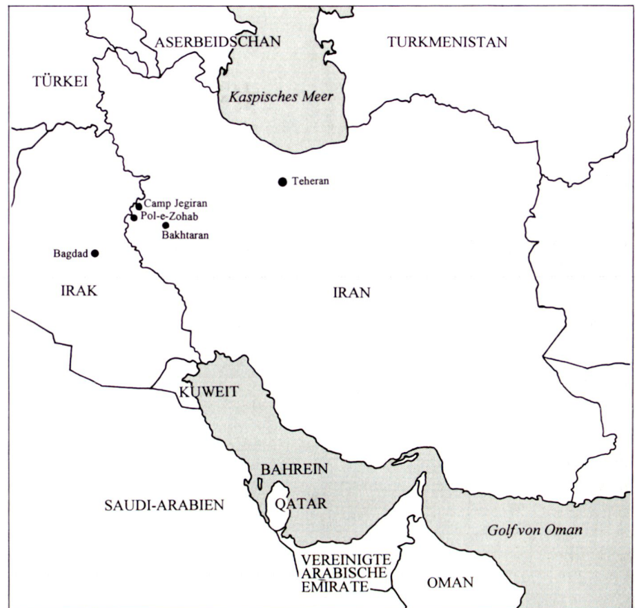
Kartenausschnitt Iran und angrenzende Länder. Einsatzgebiet der Sanitätstruppen bei «Operation Kurdenhilfe» im Westiran.

Insgesamt wurden vom 1. Mai bis zum 15. Juni in den Einrichtungen des Sanitätsdienstes ca. 25 000 Patienten behandelt.