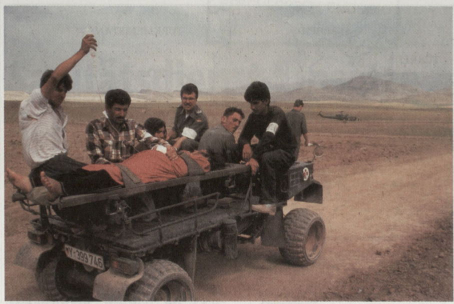
Verwundetentransport auf Kraftkarren.