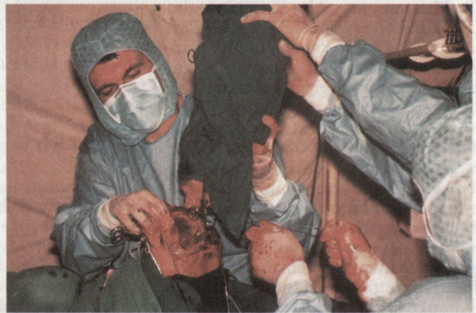
Chirurgie unter Feldbedingungen. Amputation eines durch Minen zerstörten Unterschenkels.