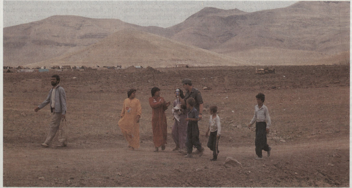
Begleitung eines schwererkrankten Säuglings aus dem Hauptverbandplatz zum Hubschrauber. Flüchtlingslager «Camp Jegiran» im Hintergrund. (Aufnahmen: Akademie des Sanitäts- und Gesundheitswesens der Bundeswehr, München)