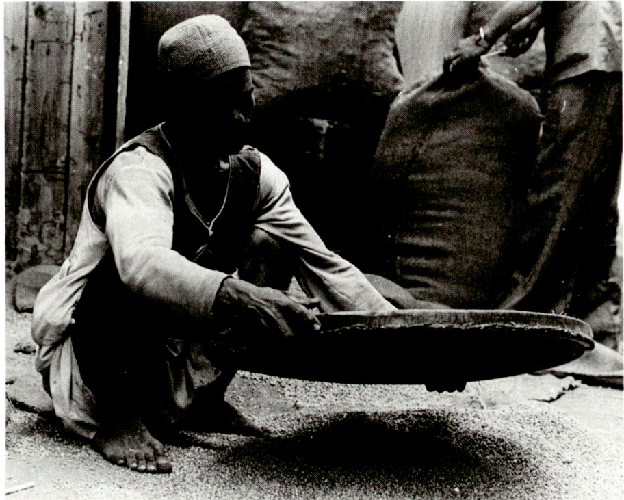
Solange in Armut lebende Menschen noch Hoffnung auf einen besseren Lebensstandard haben können, bleibt die Gefahr von Massenemigration verhältnismässig klein: Ein ägyptischer Arbeiter beim Getreidesieben auf einem Kairoer Markt.

Die Selbstbestimmungsreflexe, die bis hin zur «Alpeninitiative» wirksam geworden sind, werden sich als Gegengewicht zur Globalisierung wichtiger Lebensbedingungen verstärken und ihren Niederschlag dort finden, wo nationale Entscheidungsspielräume offen zu sein scheinen. Zu solchen Bereichen gehören das Volksschulwesen, weitgehend auch das berufliche Bildungswesen, die Kulturpolitik, weitgehend auch die Entwicklung der staatlichen Institutionen. Im Kleinstaat Schweiz, von lauter Nachbarn umgeben, die innerhalb der Europäischen Union trotz deren Mängel untereinander ein stabiles Friedenskonzept verwirklicht haben, gehört zu den von niemandem bestrittenen nationalen Entscheidungsräumen auch die Schweizer Armee. Niemand macht uns unser Konzept streitig, und die Si-