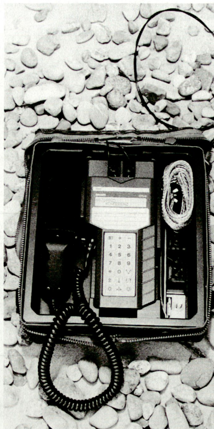
Wetterfeste, für den Einsatz im Freien konstruierte Telefonstation DTS-G.

nerseits für die Systemsoftware, andererseits für die Gestaltung und die Bedienung der Geräte. Für den Einsatz in Kommandoposten wird deshalb zurzeit eine Telefonstation entwickelt, die weitgehend bau- und bedienungsgleich ist wie ein moderner Büroapparat (DTS-K). Für den Einsatz im Freien hingegen wird eine robuste und wetterfeste Station benötigt (DTS-G, Bild). Beide Geräte verfügen über einen leistungsfähigen Display.