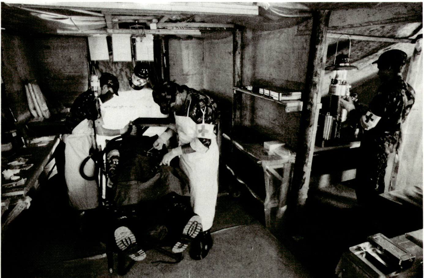
Behandlungsraum einer Sanitätshilfsstelle mit reduzierten Platzverhältnissen.

Summieren wir all diese Überlegungen, so stellt sich die Frage, wie viele Ärzte wir denn für die «Armee 95» tatsächlich brauchen. Ein kleineres Heer braucht sicher weniger Sanitätspersonal, also auch weniger Ärzte. Die Kampfverbände haben aber nach wie vor ihren Verteidigungsauftrag,