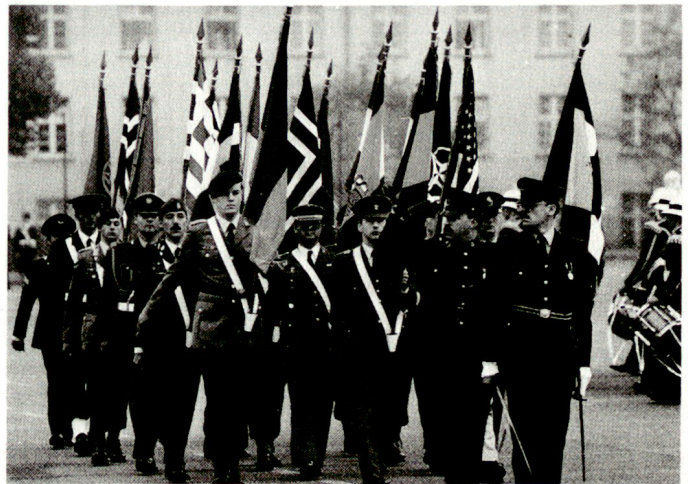
Durch die rechtliche Absicherung für «Out-of-Area»-Einsätze der deutschen Bundeswehr hat das Eurokorps an Bedeutung gewonnen.

Das Eurokorps ist die Streitmacht der WEU, dem militärischen Arm der EU. Es besteht zurzeit aus der 1. Französischen Division, der 10. Deutschen Panzerdivision, der 1. Belgischen Mech Div, der deutsch-französischen Brigade. Unter anderem geht es darum, nicht-organische Detachements zu