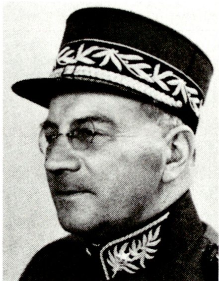
Edgar Schumacher (1897–1967) von Rüscheegg (BE) war 1945 und 1946 Kommandant der Zentralschulen. Von 1947 bis 1956 kommandierte er die Felddivision 6.

von Oberstleutnants zu Regimentskommandanten geschaffen. In den fünfziger Jahren wurden diese Kurse zur Zentralschule III-A. Am Ende des zweiten Weltkrieges wurden die Gruppe für Ausbildung sowie das Kommando der Zentralschulen gegründet. Auf Beginn des Jahres 1945 wurde Oberst Schumacher als Kommandant der Zentralschulen gewählt und der Hauptabteilung III, Truppengattungen, unterstellt. Die Kurse für Nachrichtenoffiziere und Adjutanten wurden im Laufe der Jahre in Technische Schulen I und II und Technische Kurse (TK) für Nachrichtenoffiziere