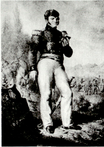
Salomon Hirzel (1790–1844) von Zürich stand als Artillerieleutnant im 2. Schweizerregiment in den Diensten von Napoleon. 1831 Generalinspektor der schweizerischen Artillerie.

In den dreissiger Jahren des letzten Jahrhunderts führten politische Spannungen zu einem Niedergang der Zentralschulen. Nachdem 1835 die Eidgenössische Militäraufsichtsbehörde keine Instruktooren mehr fand, um die Stellen zu besetzen, wurde 1839 der Tiefpunkt der Zentralschulen da-