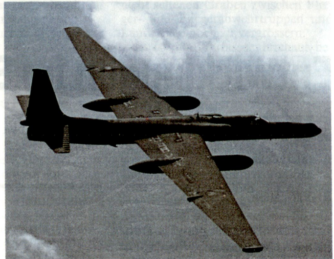
Abb. 2. Taktisches Luftaufklärungsflugzeug der USAF, Lockheed U-2R. (Länge 19,2 m; Spannweite 31,4 m; Höhe 5,2 m; Gipfelhöhe 21 400 m/M)

1991 wurden die damals vorhandenen Prototypen mit Erfolg eingesetzt.