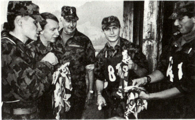
OS 94: Fischzubereitung während der Durchhalteübung.

die Effizienz der militärischen Systeme verstärkt. Die zivilen und die militärischen Kenntnisse ergänzen sich so gegenseitig.