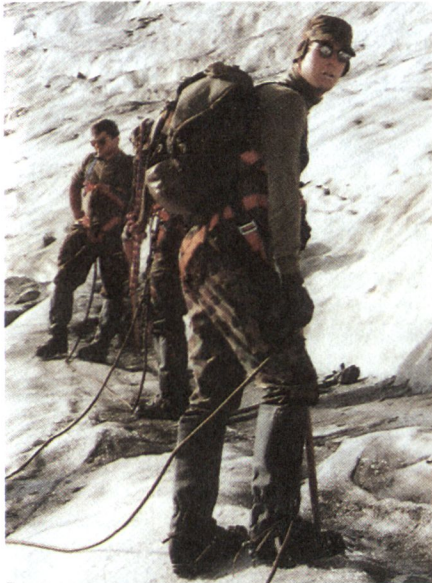
OS 94: Gebirgsverlegung Furka