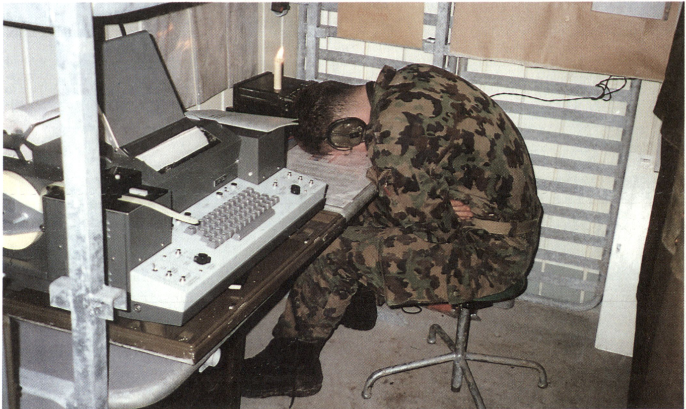
OS 94: Aspirant am Chiffriergerät TC-850 während der Durchhalteübung

Vorbild garantieren sie den Erfolg der OS. Erfolg motiviert und überträgt sich vom Instruktor auf den Aspiranten und wieder zurück.