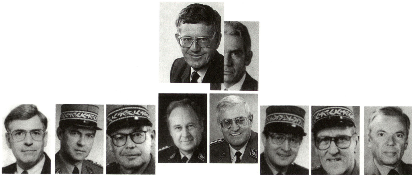
Die für den Frieden konzipierte «Geschäftsleitung» der Schweizer Armee

Besonders bedeutsam ist dabei die Funktion und Stellung des Generalstabes in Friedenszeiten. Er «definiert die militärischen Vorgaben, legt die operative und taktische Doktrin fest, steuert und koordiniert zwischen den einzelnen Systemeinheiten (Heer/Armee-korps, Luft, Support) und überprüft die Umsetzung (Armee-Controlling)».