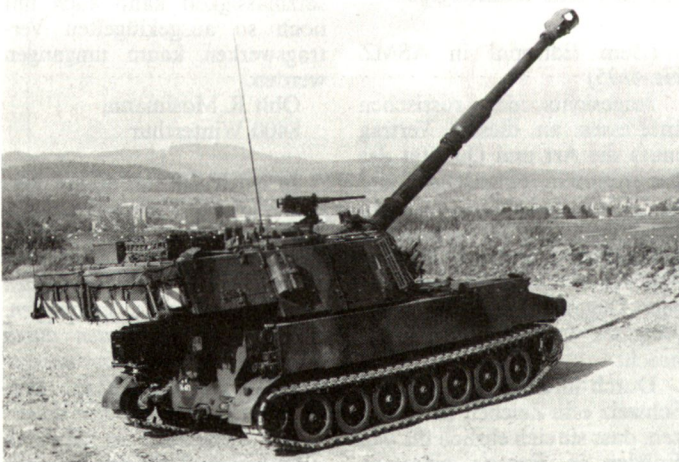
Kampfwertsteigerung Panzerhaubitze M-109. Äussere Merkmale: längeres Geschützrohr, Flecktarnanstrich und «Rucksack» am Turmheck, welcher ermöglicht, mehr Munition mitzuführen.

Als Ersatz der Schlauchbootbrücken 61 werden moderne Schwimmbrücken beschafft, die vor allem den Panzerverbänden dienen, die auf rasch herstellbare Flussübergänge angewiesen sind; eine hundert Meter lange Brücke, die schwere Kampf-