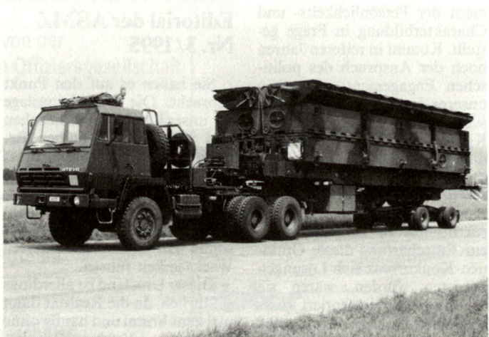
Schwimmbrücke 95. Sattelmotorfahrzeug mit Brückenmodul.