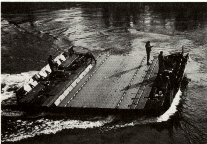
Schwimmbrücke 95. Verschieben des eingewässerten Moduls an die Brückenbaustelle.