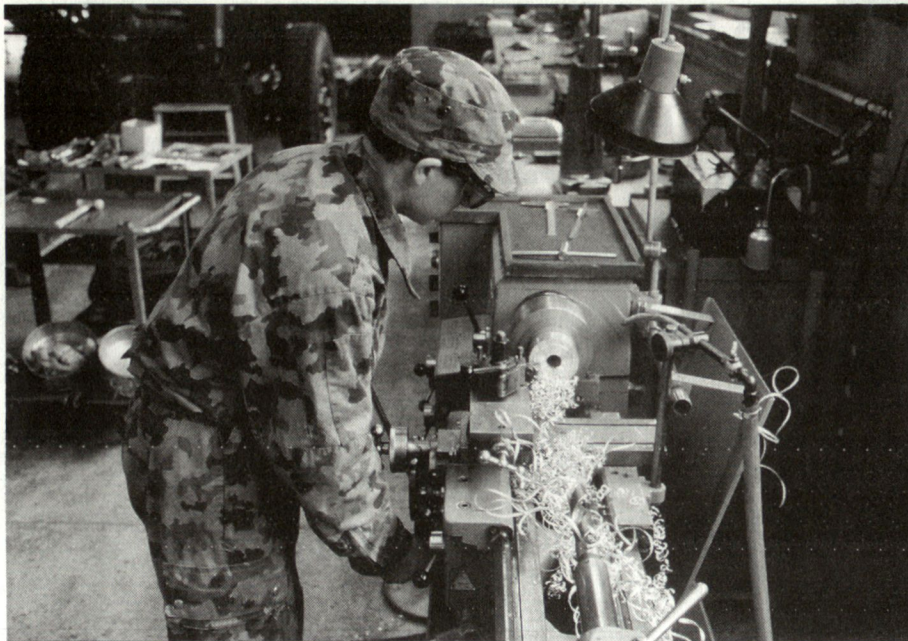
Milizsoldat an der Arbeit im Zeughaus Thun.

sten unterer Stufen Depots zu bilden. Dabei darf man sich allerdings nicht von Zeltblachen überdeckte Palette mit Munitionskisten und Konservenbüchsen vorstellen. Die Betriebsinfrastruktur der logistischen Bundesämter, also Werkstätten und Lager, wurde auch in Räumen errichtet, die dem wahrscheinlichen Truppeneinsatz entsprachen. Nachdem neu ein Armee-Einsatz mit lagebedingter Schwergewichtsbildung erfolgen wird, die Armee um einen Drittel verkleinert wurde und eine tiefere Bereitschaft angesetzt werden kann, waren hier entscheidende Anpassungen vorzunehmen.