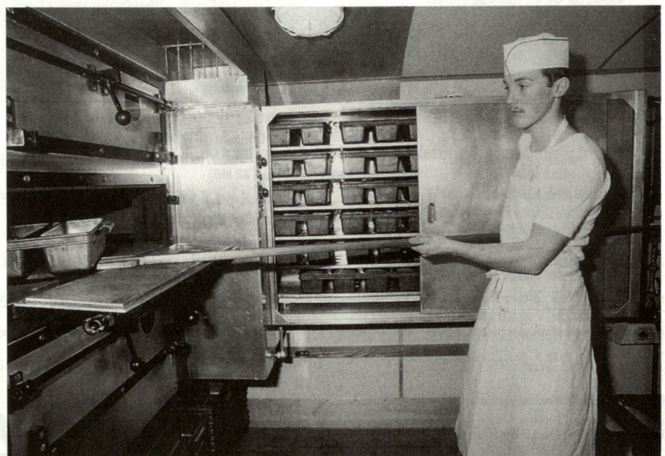
Bäckersoldat bei der Brotherstellung in Feldbäckerei.

Theoretisch wäre es zwar wünschenswert, dass für jeden Verband die notwendigen Transportmittel startbereit in seinem Zeughaus bereitstünden. Aber abgesehen davon, dass viele Verbände weniger Fahrzeuge brauchen, sobald sie ihren Einsatzraum erreicht haben, hätte diese Lösung – nebst den hohen Beschaffungskosten – weitere auffallende Nachteile.