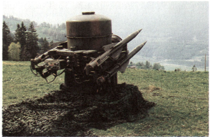
Abb. 2: Die «Rapie»-Feuereinheit wird mit Vorteil auf einer über dem zu schützenden Flugplatz gelegenen Anhöhe in Position gebracht. (Flab Br 33)

Fahrer) ausgebildet. Während der Rekrutenschule erfolgt die Verbandsausbildung auf den Stufen Feuereinheit und Batterie.