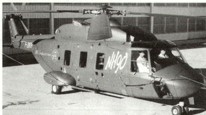
Nach den Entscheidungen gegen den Kampfhelikopter Tiger hofft die europäische Rüstungsindustrie auf Bestellungen für ihren neuen Transporthelikopter NH 90.