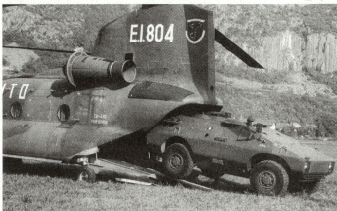
Der leichte Schützenpanzer Puma (4x4) kann mit Transporthelikoptern (Bild CH-47) verschoben werden.

schweren gepanzerten Radfahrzeugen Centauro (Kanone 105 mm, 400 Stück bis Ende 1996 verfügbar!) bestückt sind. Der Puma ist relativ leicht und kann gut durch die Transportflugzeuge G. 222 und C-130 sowie die schweren Helikopter CH-47 verschoben werden.