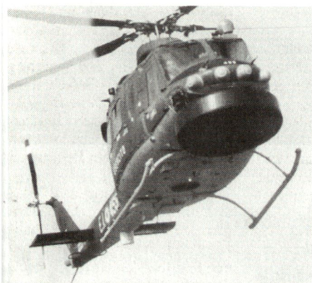
Beobachtungshelikopter Creso, ausgerüstet mit modernem Überwachungsradar.

Eine Idee der Komplexität vermittelt der Teil «Luft» des CATRIN-Systems: Da ist der Helikopter Creso zur Gefechtsfeldüberwachung im Einsatz und ein Drohnenaufklärungssystem, das Mirach 26. Der Creso ist aus einem Agusta-Bell 412 (5,4 t) hervorgegangen, mit