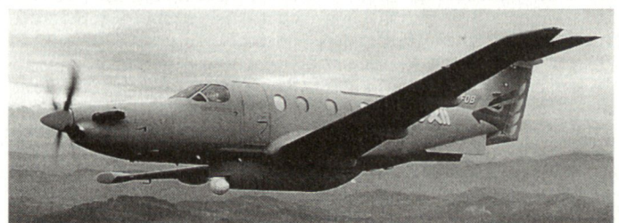
Überwachungflugzeug Pilatus Eagle

Die Konfiguration ist in erster Linie als flugfähige Plattform für die verschiedensten Erkennungs- und Überwachungsaufgaben gedacht, kann aber in kürzester Zeit (ca. 5 Stunden) in eine Standardversion oder in eine Ambulanzversion umgebaut werden. hg