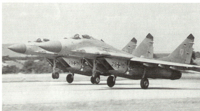
Nur wenige der von der NVA übernommenen Waffensysteme werden heute in der Bundeswehr weiter genutzt, u. a. auch die Kampfflugzeuge MiG-29.

Die Anforderungen an das System wurden vom Taktikzentrum des Heeres unter Beteiligung der Truppschulen und der Sanitätsakademie der Bundeswehr erarbeitet.