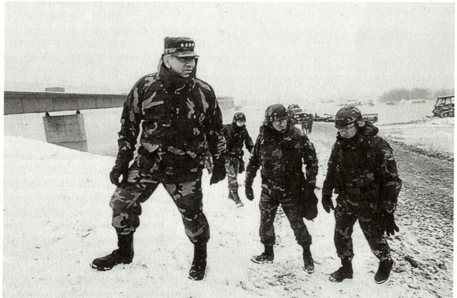
General George A. Joulwan besichtigt den vorgesehenen Standort der Pontonbrücke an der Save.

NATO und SHAPE sind heute so wichtig wie in der Vergangenheit. Unsere neuen Aufgaben beanspruchen uns heute aber weit über den Fall der Berliner Mauer, den Fall des Eisernen Vorhangs oder den Sieg über eine Ideologie hinaus. Wir bemühen uns um die Konsolidierung auf ein echtes Ziel: ein freies Europa vom Atlantik bis zum Ural – ein Europa mit stabilen demokrati-